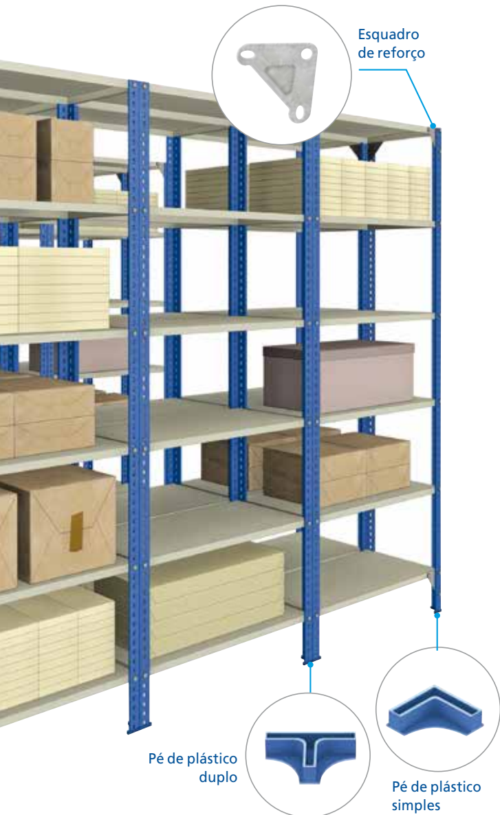
Pé de plástico duplo