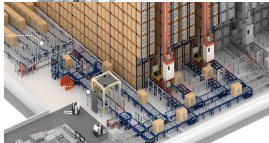
Transportadores automáticos que comunicam o armazém com a área das docas e postos de entrada